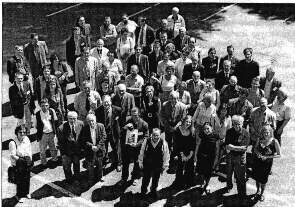
Boguchwała, 4 VI 2005 r.